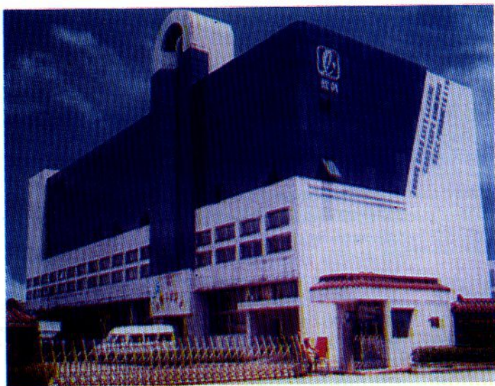
Производственный комплекс компании „ЛИКЭ”

Новая продукция из кордицепса китайской государственной компании „League” – биоиммуноэнергорегуляторы быстрого действия совершают переворот не только в восточной, но и в мировой традиционной медицине.