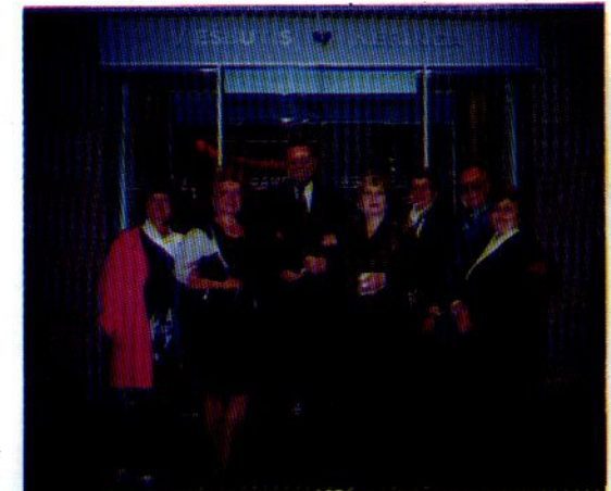
Консультанты Международной Системы SSS из Литвы

SL 1543. 437. A. Malinausko II Tiražas 1000 egz.