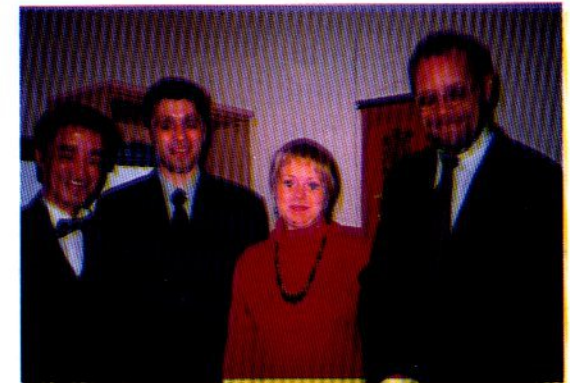
С Президентом Международной Карьеры SSS господином Ли Луцзы

АРКАДИЙ ГАМПЕРИС УНИКАЛЬНЫЕ ПРЕПАРАТЫ КИТАЙСКОЙ КОМПАНИИ LEAGUE